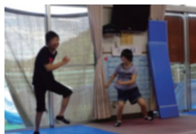
USA!! カッコいい ダンス