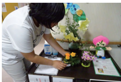
ペットボトルを使ったフラワーアレンジメント