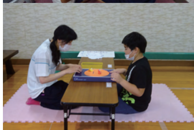
トントン寿司ずもう