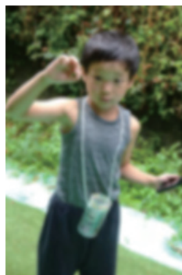
虫のことなら まかせて！！ 「ナナフシつかまえたよ」