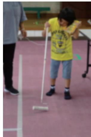
コロコロ クリーナー