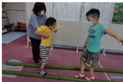
この頃は 竹橋ドンジャンゲームに発展！！